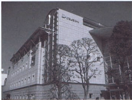
いちようホール正面玄関全景