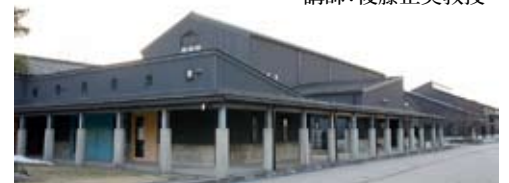
セミナー会場：金沢職人大学校

申込み/問合せ先 伝統木構造の会 渋谷区代々木2-36-6〒151-0053 電話03-3370-8528, Fax.03-3375-8447 Mail: dentou@mbn.nifty.com