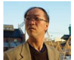
講師：後藤正美教授

石川県金沢市大和町1-1 ●クルマ/金沢西インターから約10分 ●JR金沢駅(西口)から徒歩20分、タクシー5分