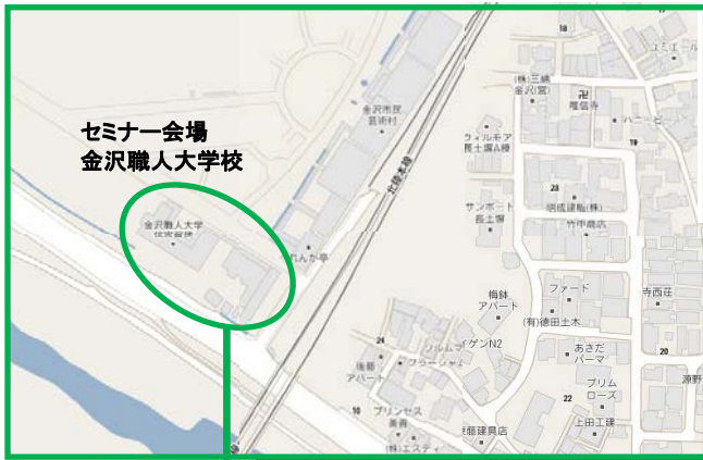
セミナー会場 金沢職人大学校