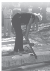
マサカリ実演 鶴岡セミナーでの様子(2008)

有明山のふもと宮城にあり、有明山を信仰崇拝する山岳信仰神社で、祭神は天の岩戸を開いた天手刀雄命ら三神・日光の陽明門に似せてつくったといわれる裕明門の彫刻と神楽殿の天井画が特に見栄えがあり、美しい庭園とともに親しまれている。