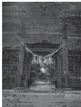
有明神社裕明門(町指文)※2

昭和48年に国の重要文化財に指定され、切妻造板葺平入で長坂石置屋根、見せ貫きの建築で、江戸時代前期の建て物で本棟(ほんむね)造系統に属する民家としては日本最古のもの。