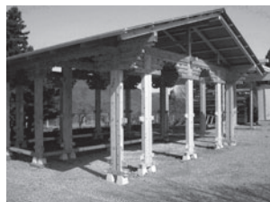
信州事務局間伐フレーム※3

平成20年度地域活性化推進事業に信州事務局の応募が採択され、開発した間伐材フレーム。