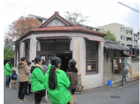
奈良・きたまちの旧鍋屋派出所 地元の方々の熱意で保存し、地元のボランティアが「駐在さん」になり運営

1989年から東南アジアの建築・遺跡の研究・保護に関わり、現在に至る。日本建築史・東南アジア建築史が専門。工学博士。